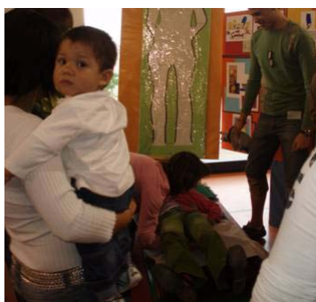
Física sobre presión