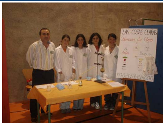
Las cosas claras Colegio Santa María de la Huerta Almoradí