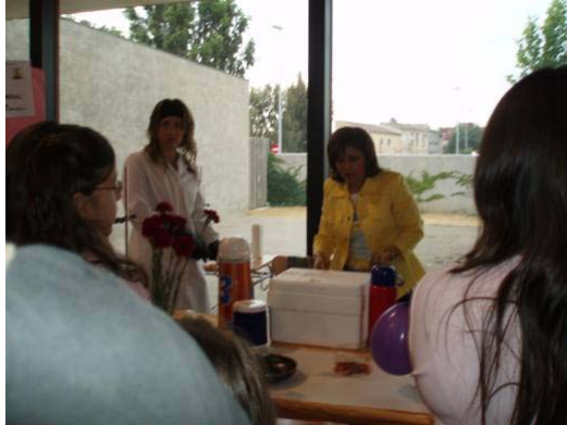
Frío, frío, frío IES El Palmeral Orihuela