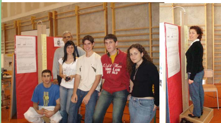
Báscula de presión